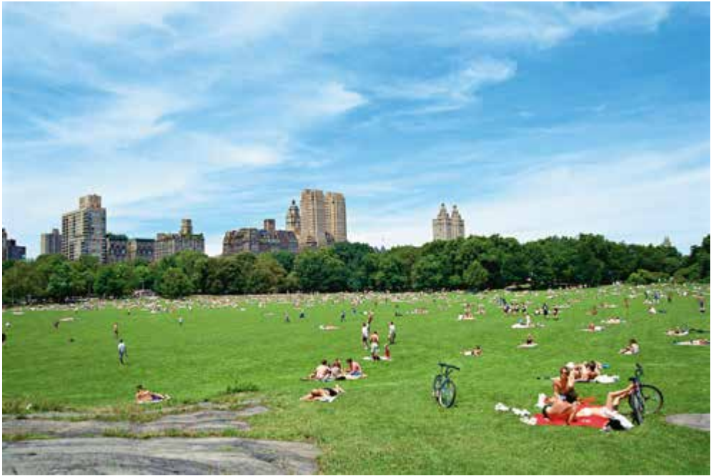
Ryc. 333. Nowy Jork, Central Park

talnymi tarasami i fontannami na południowym brzegu jeziora, a na północnym – poszarpane wzgórze z labiryntową siecią krętych dróg spacerowych i belwederem ( The Ramble ). Poza częścią spacerowo-wypoczynkową z łąkami do leżakowania, urządzono kąpieliska, tereny zabawowe dla dzieci i młodzieży, boiska, mały ogród botaniczny i zoologiczny, drogi do przejażdżek konnych oraz kawiarnie i restauracje, połączone z siecią dróg pieszych i samochodowych o łącznej długości około 80 km. W późniejszym okresie po zlikwidowaniu starych prostokątnych zbiorników wodnych, znajdujących się na wprost muzeum metropolitalnego, utworzono nowe jezioro, amfiteatr i wielką polanę trawnikową. Park ozdabiają liczne pomniki (ryc. 333, 334).